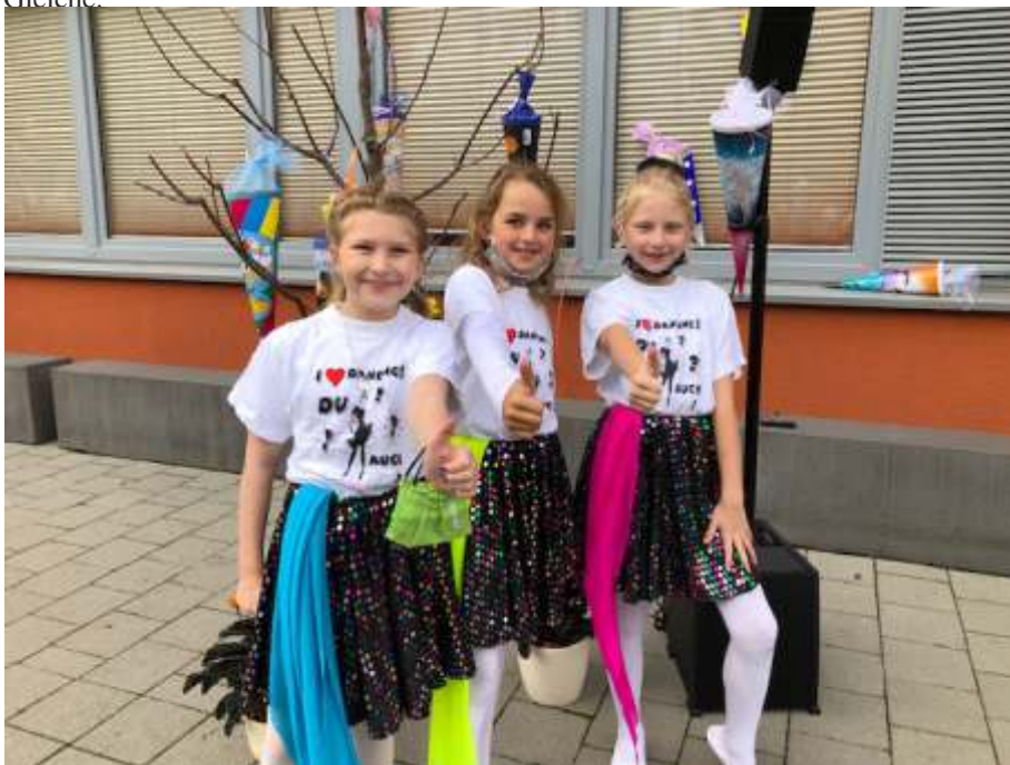
Schuleinführung in der Schiller Schule