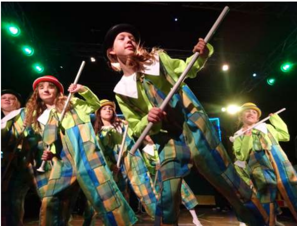
Die Tanzsterne mit dem Harlekin