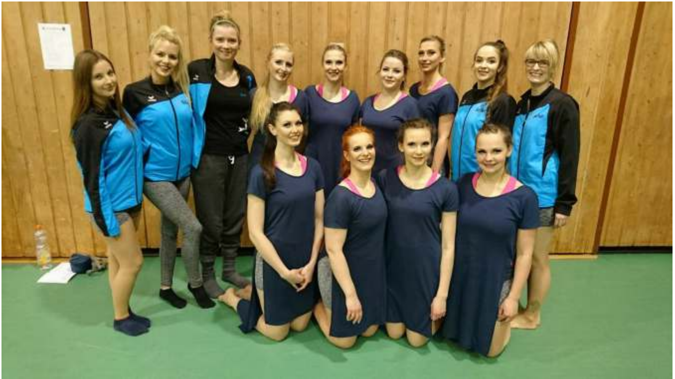
Unsere Formation TenDance

Am 18. März war das erste Turnier der neuen Saison in Klein-Gerau. Dies ist in der Nähe von Stuttgart, also eine Fahrtdauer von mindestens 3 1/2 Stunden. Dank Autohaus Fischer, die uns wieder ein gutes Preisangebot bzgl. des Transporter gemacht haben und Inkcompany die uns eine Spende zukommen ließen, wurde uns die Fahrt sehr erleichtert.