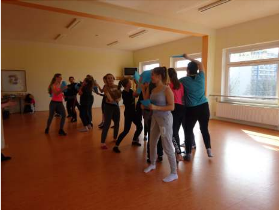
Gemeinsames Training mit Schnapphans

Wenn dann alle Tänzer die Choreographie perfekt beherrschen, werden wir uns wieder treffen und den Rest einstudieren. Später sind gemeinsame Auftritte geplant, wie z. B. die Weihnachtsrevue am 17.12. im Sporthallenkomplex Lobeda West. Wir danken auch den fleißigen Muttis, die die Pausenversorgung übernommen haben und viele Salate gemacht und Kuchen gebacken haben.