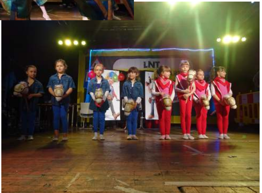
Bibi und Tina präsentierten die Steppkes

Am 26. Februar fand für uns der letzte Auftritt für diese Faschingsaison statt. Wir waren zum Kinderfasching des LNT ins F-Haus eingeladen. 14.30 Uhr trafen sich die Steppkes und Tanzsterne am Hintereingang des F-Hauses. Zum Glück war es diesmal nicht so kalt (wie andere Jahre), denn der Wind pfeift dort immer ganz schön durch die Gasse. Und wir standen und standen, denn wir warteten auf ein Kind. So gingen erst einmal die Tanzsterne hinein zum Umkleiden, denn die Zeit wurde langsam knapp. Irgendwann konnten aber auch die Steppkes nicht mehr länger vor der Tür warten und wir gingen ohne das fehlende Kind hinein. Wir hofften, dass sie noch kommt. Also probten die Steppkes mit Lücke, zogen sich um und dann kam die Meldung... Kind kommt nicht. Nun wieder alles von vorn und den Tanz umgestellt.