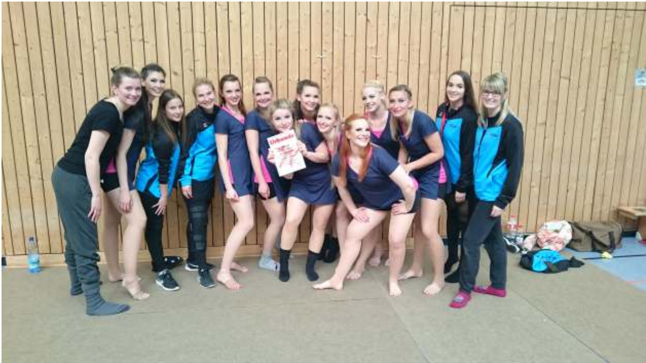
TenDance diesmal im großen Finale

Am 22. April hatten wir unser 2tes Turnier in Saalfeld, also keinen langen Fahrweg, jedoch starteten wir genauso früh. Denn desto näher man wohnt, desto eher ist man mit Eintanzen dran. So tanzten wir uns schon gegen 9.00 Uhr ein. Das Turnier fand wie jedes Jahr in der Dreifelderhalle ins Saalfeld/Gorndorf statt. Es geht dort immer recht eng zu und wir mussten uns die Kabine mit einer anderen Formation teilen. Die Stimmung in der Gruppe war gut, jedoch merkte man eine gewisse Anspannung " Wie wird wohl heute die Wertung ausfallen? "