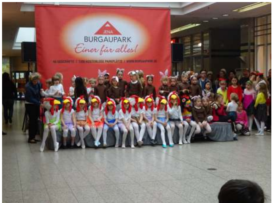
Die Little Tigers der Schiller Schule warten auf den Auftritt

Am 7. April, kurz vor Ferienbeginn, fand noch der Osterauftritt im Jenaer Burgau Park statt. Viele Kinder aus der Schiller Schule waren gekommen und einige hatten ihren ersten Auftritt. So präsentierten die Little Tigers ihren Hühnertanz. Sie hatten für ihre erste Vorführung fleißig geübt und alles klappte gut. Die Tanzteufel der Schiller Schule haben schon etwas mehr Auftrittserfahrung und sie präsentierten ihren Turntigertanz sowie Tüchertanz. Am Ende durften sie sogar mit den „Großen“ bei „Don't worry“ mitwirken. Aus Winzerla waren auch die kleinen Harlekine gekommen. Dies sind Vorschüler und proben ebenfalls jeden Dienstag Nachmittag in der Schiller Schule. Sie sind schon kleine Auftrittsprofis und viele tanzen bereits seit dem dritten Lebensjahr in unserem Verein. So klappte auch alles perfekt bei Hoppelhase Hans sowie den Frühlingstanz.