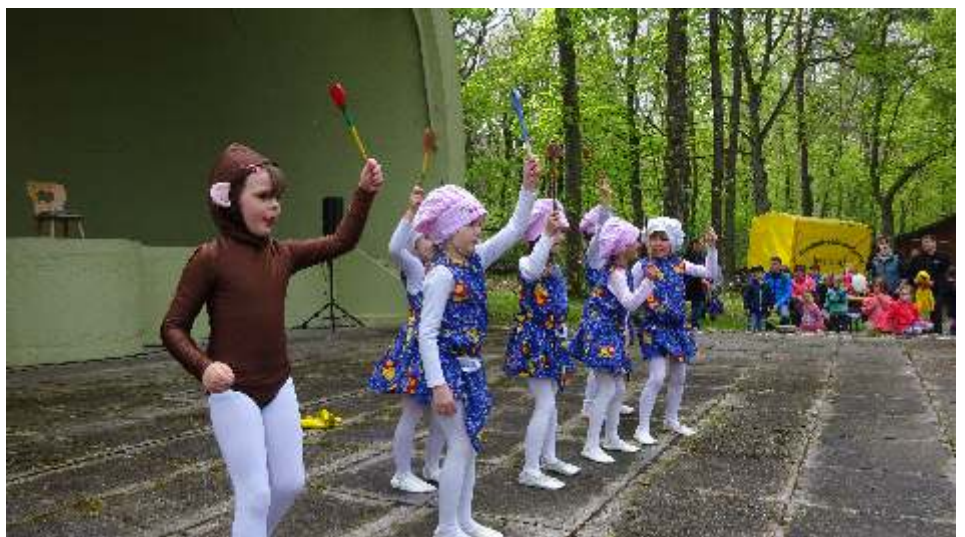
Die Little Dolls mit Crazy Banana