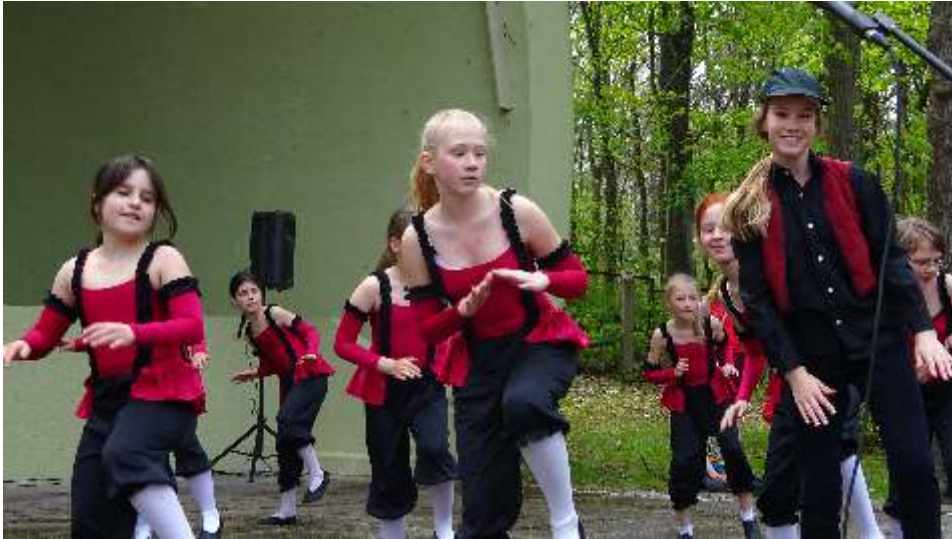
Die Tanzsterne mit Es rappelt im Karton

Hinter der Bühne halfen alle Eltern vor allem den kleinen Tänzern beim Umziehen. Am Ende der Veranstaltung lag im Pavillon ein „Haufen“ von Kostümen und jeder suchte verzweifelt nach seinem Strumpf, Handschuh usw. um das richtige Kostüm wieder mit nach Hause zu nehmen. Ein paar Ameisen und Käfer hatte dann jeder auch noch mit eingepackt. Aber das ist halt ein Auftritt in Natur und einmal ein ganz anderes Erlebnis. Es hat auf alle Fälle großen Spaß gemacht und wir kommen gern wieder auf den Schott Platz.