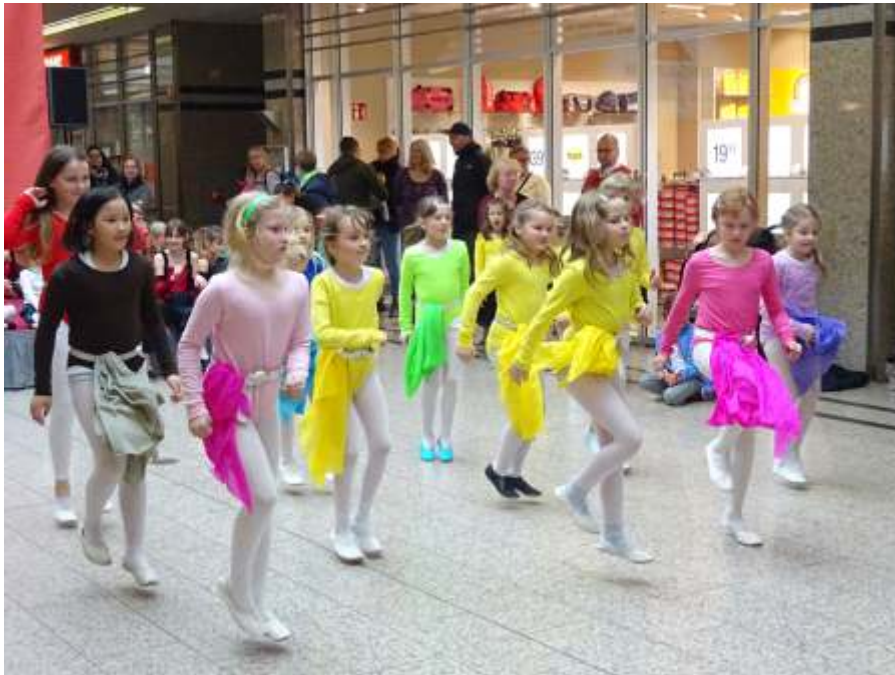
Die Tanzteufel der Schiller Schule mit Turntiger

Aber auch unsere Auftrittsgruppen Tanzsterne, Future Dancer und Confused waren mit am Start. Sie erhielten für ihre Darbietungen viel Beifall. Hinter den Kulissen im Umkleidegang herrschte immer ein Gewusel, denn es mussten sich ca. 60 Kinder blitzschnell umkleiden. Vor der Bühne drängten sich immer mehr begeisterte Zuschauer und wollten das Programm sehen. So kamen an den Seiten die Leute mit den Einkaufswagen kaum noch durch. Am Ende präsentierten sich alle Tänzer noch einmal zum Finale und der Applaus wollte nicht enden. Einige riefen sogar „Zugabe“. Ein Dank auch an den Techniker des Burgau Parks, der für den guten Ton sorgte. Ein Dank aber auch an die Eltern, die beim Gewusel hinter der Bühne beim Umkleiden mithalfen, damit die Kinder wieder rechtzeitig in ihren schönen Kostümen am Start waren.