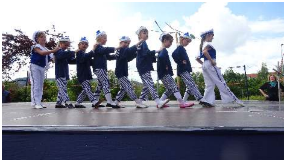
Die Steppkes mit dem Matrosentanz