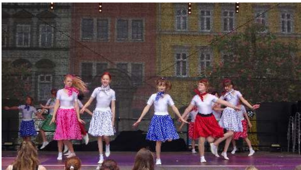
Uraufführung vom Rock`n Roll der Tanzsterne