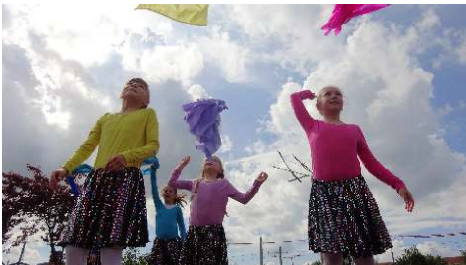
Die Kulturanum Schule mit dem Tüchertanz