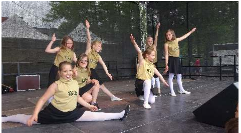
Die Tanzmäuse der Heine-Schule mit Nur geträumt

Bühne unser Programm. Die Steppkes präsentierten ihren Piratentanz und Bibi und Tina. Leider fehlte plötzlich ein Mädchen, so dass die kleinen Tänzer alles umstellen mussten. Besonders aufgeregt waren die Flotten Spatzen der Heine Schule, denn viele hatten ihren ersten Auftritt. Sie machten das ganz toll, wenn