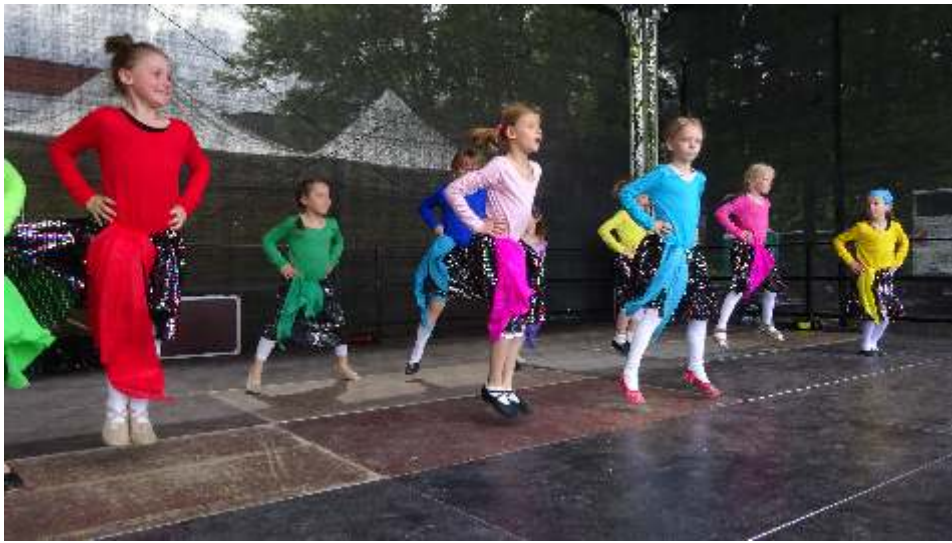
Die Flotten Spatzen aus der Heine-Schule

auch am Ende eine Stelle komplett vergessen wurde uns sie sich am Ende wunderten, warum der Tanz alle war... die Musik aber noch nicht. Mehr Auftrittserfahrung haben da schon die Tanzmäuse der Heine Schule. Sie waren aber auch aufgeregt, denn sie zeigten zum ersten Mal den Tanz Nur geträumt. Ihnen merkte man die Aufregung aber nicht an und sie schafften all ihre Tänze perfekt. Am Ende vereinten wir uns beim Finale „Hände hoch“ und dann sprangen die Tänzer sogar ins Publikum und tanzten mit den kleinen Zuschauer gemeinsam den Tanz. Erst waren die Kinder im Publikum total überrascht, aber dann tanzten sie unseren Tanz ganz toll mit.