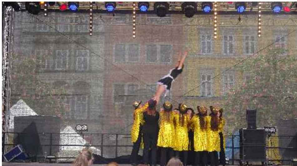
Gemeinsam tanzten Time warp die Future Dancer und Confused