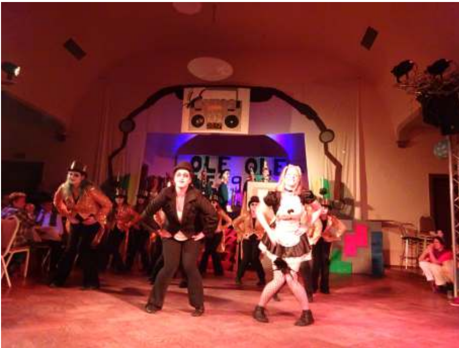
Viel Stimmung beim LKC in Laasdorf

Nun hatte die Karnevalssaison begonnen und wir waren zur Ü-30 Party nach Laasdorf eingeladen. Dieser Termin lag genau vor Ferienbeginn und so waren einige Tänzer von Confused verreist. Zum Glück hatten die (etwas jüngeren) Mädchen von den Future Dancern diesen Tanz auch einstudiert und so sprangen sie ein. Das bedeutete natürlich, dass sich die Mädchen einen Tag vor dem Auftritt noch einmal zu einer gemeinsamen Probe treffen mussten. So probten sie nicht nur an der Choreographie sondern vor allem auch an der Pyramide. Das klappte ganz gut uns so trafen sich die Mädchen eine Stunde vor Auftrittsbeginn in Laasdorf, denn sie wollten vor Ort alles noch einmal durchlaufen. In dem Saal war zwar in der Tiefe genug Platz, doch in der Breite wurde es eng und so passte unsere Reihe aus 14 Mädchen nicht hin. Also wurden daraus zwei Reihen... war auch kein Problem. Nun ging das aufwendige Schminken los. Die Mädchen verwandelten sich in Zombis. Das dauerte fast 1 Stunde und so hatte das Programm schon lange begonnen und wir pinselten noch immer. Zum Glück waren die Mädchen erst gegen 21.00 Uhr an der Reihe und bis dahin hatten wir alle geschminkt. Dann marschierten wir unter den Applaus der vielen Zuschauer ein und das Publikum war schon sehr gespannt. Sie wussten vom vorigen Jahr, dass das Show-Ballett Formel I immer für eine Überraschung sorgt. Und so war es auch diesmal, denn unser Time warp aus der