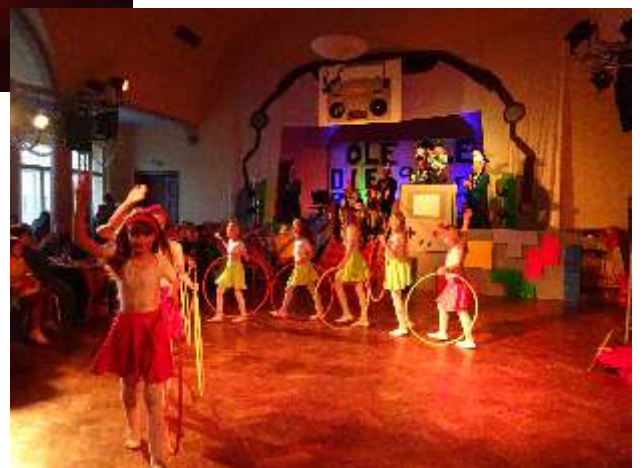
Ausmarsch für die Tanzsterne