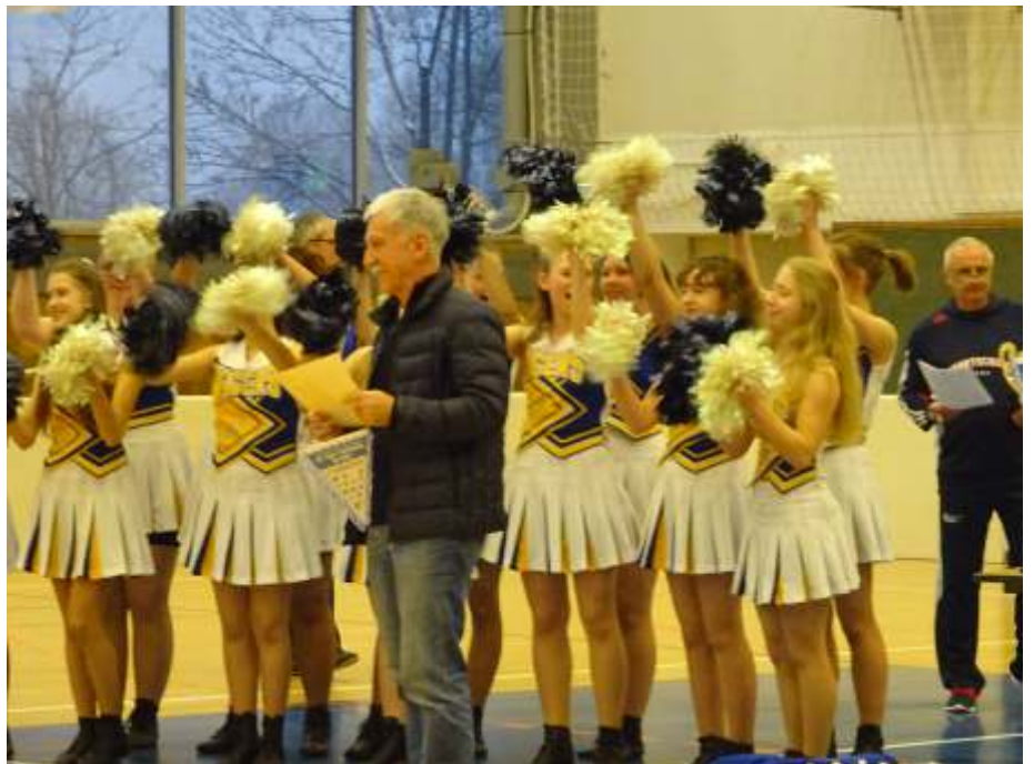
Zur Siegerehrung sorgten wir für tolle Stimmung