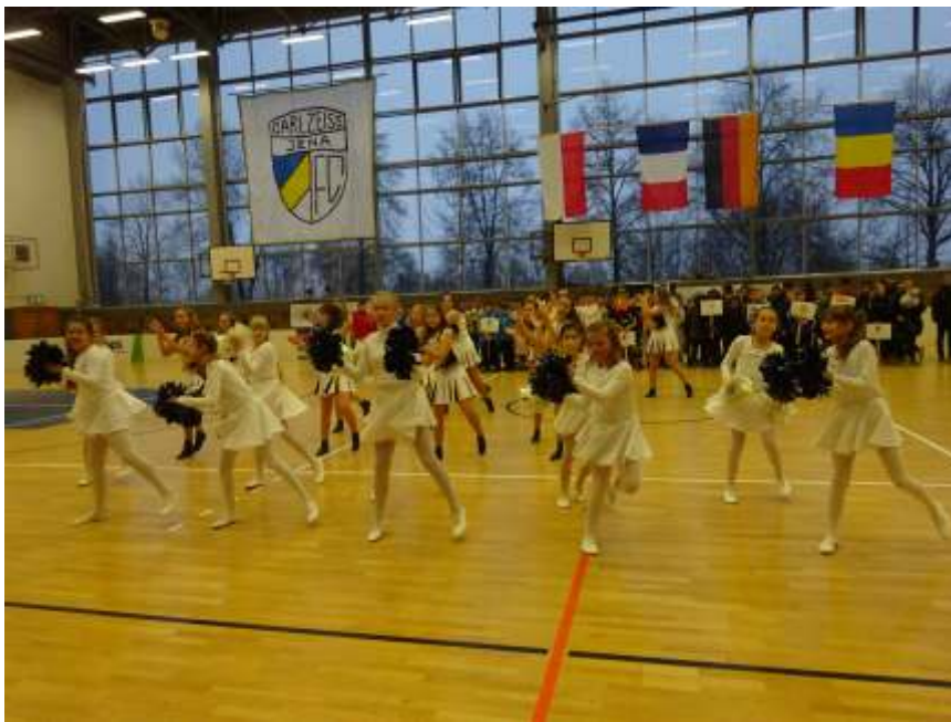
Vor der Siegerehrung präsentierten wir einen flotten Tanz

Vom 7.-8. Januar fand das traditionelle Schnieke-Gedenkturnier im Sporthallenkomplex Lobeda-West statt. Die C2-Junioren des FC Carl Zeiss Jena hatten zum 30. Turnier eingeladen und es waren 12 Mannschaften (+ zwei vom FCC) angereist. Am Samstag wurde das Turnier 12.15 Uhr offiziell eröffnet und wir begleiteten die Mannschaften aufs Hallenparkett. Die Mädels von Confused präsentierten dann ihren Tanz Bullett proof und damit war unser Einsatz für diesen Tag schon vorüber.