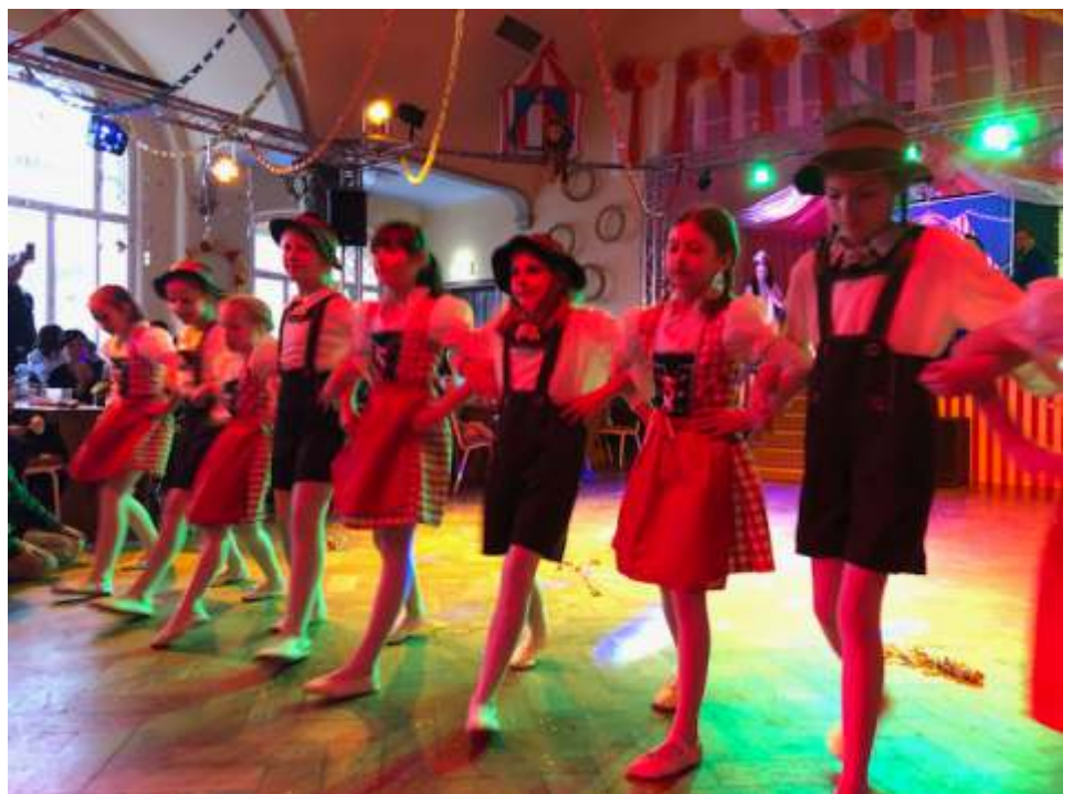
Die Future Girls mit Amore