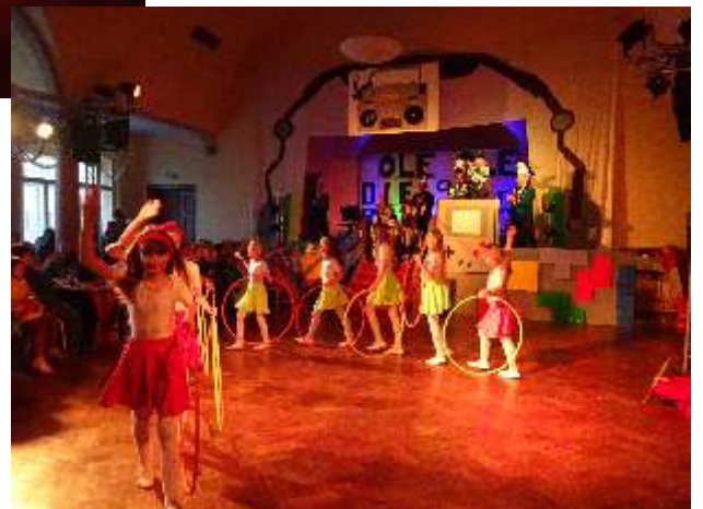
Ausmarsch für die Tanzsterne