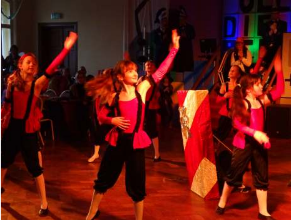
Es rappelt im Karton

Dann ging es 14.30 Uhr los und wir waren als viertes an der Reihe. Und siehe da, alle Gehirne eingeschaltet... und er Tanz lief perfekt. Das kleine und große Publikum klatschte begeistert mit. Nun hieß es schnell umziehen, denn wir waren schon als Nummer sechs wieder an der Reihe. Schnell die Treppe hoch gerannt und in das Hula Hoop Kostüm geschlüpft. Haare auf, andere Schuhe an und die Treppe wieder runter. Alle hatten es pünktlich geschafft und so marschierten wir zum zweiten Mal ein. Es wurde zwar fast zu eng für den Reifenschwung, doch alles lief am Ende sehr gut und die Mädchen wurden beim Ausmarsch mit einem riesen Applaus begleitet. Die Tänzerinnen freuten sich dann noch über Pfannekuchen und Schokoküsse. Zufrieden traten sie die Heimreise an. Danke auch an alle Eltern, die die Kinder gefahren haben.