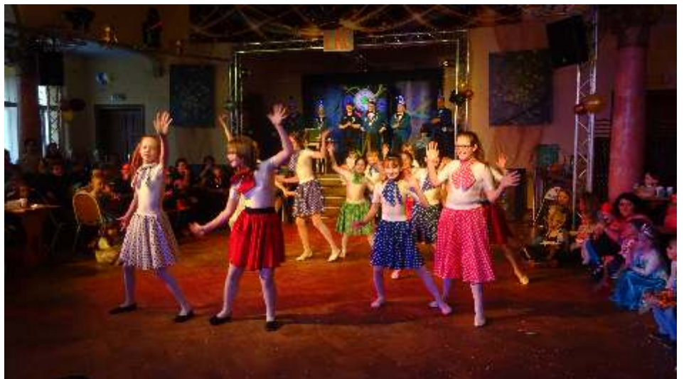
Die Stardancer mit ihrem Rock`n Roll