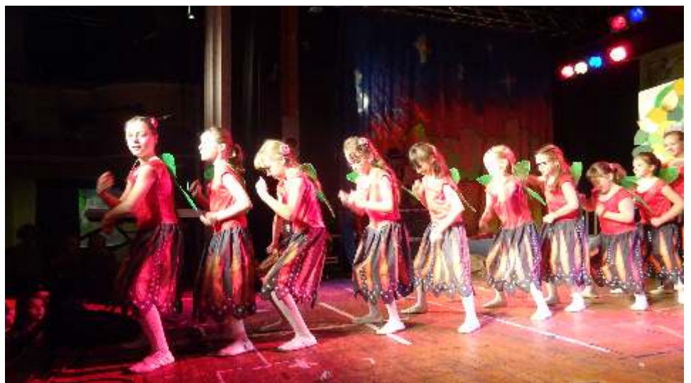
Die Happy Dancer mit den Feen

Am 11. Februar fand im F-Haus der Kinderfasching des LNT statt. Leider sterben immer mehr Karnevalsvereine in Jena aus. Der LNT kann nur noch den Kinderfasching ermöglichen, die Karnevalsgala im Volkshaus wurde aus finanziellen Gründen abgesagt und so sieht es um den Fasching in Jena immer schlechter aus. Um so erfreuter waren wir, dass unser Verein wieder im F-Haus dabei war. Die Steppkes und die Happy Dancer waren diesmal mit am Start. Der Termin lag zwar etwas ungünstig, da die Ferien gerade endeten und noch einige Mitglieder auf der Rückreise von ihrem Ferienort waren, aber trotzdem schafften wir es, dass genug Tänzer auf der Bühne standen. Die Happy Dancer mussten zwar noch eine kleine Umstellung vornehmen, da ein Kind erkrankt war, aber sie haben das gut gemeistert. Etwas ungewohnt war, dass sie auf die Bühne mit einem Einmarsch begleitet wurden. Auch die Rakete zum Dank war etwas außergewöhnliches für unsere Mädchen, aber es hat Spaß gemacht. Die Steppkes kamen auch recht schnell am Anfang des Programm an die Reihe.