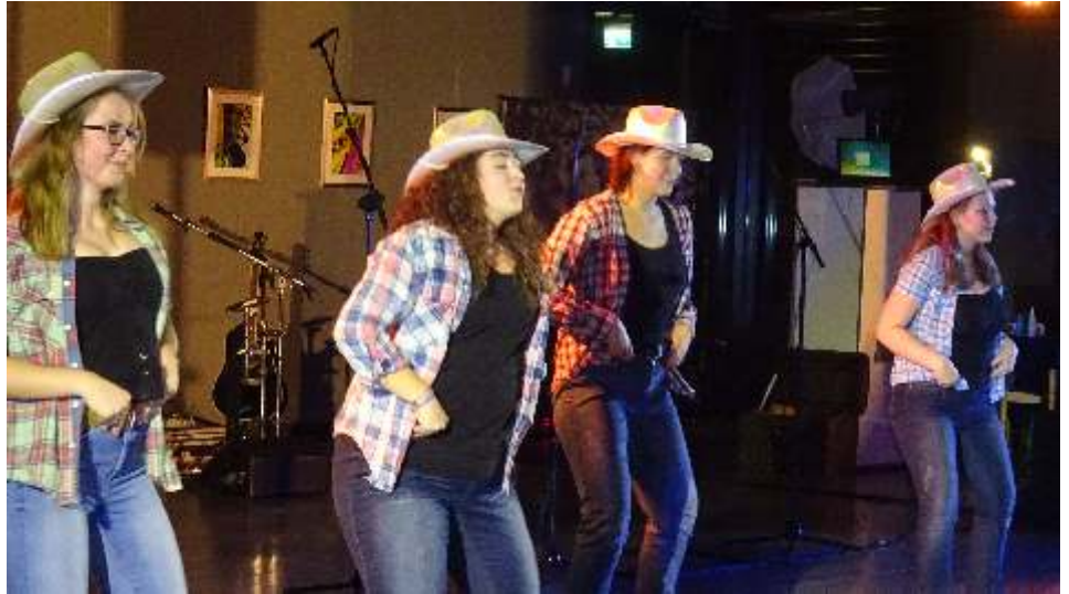
Cowboy mit der Gruppe Confused