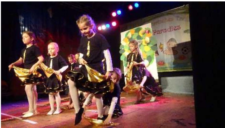
Die Steppkes mit der Blinden Kuh

Sie waren 12 Kinder und bei den langen Reihen hatten sie Mühe, dass sie nicht vorn von der Bühne purzelten bzw. hinten in der Deko klebten. Sie haben es ganz toll gemacht und bekamen viel Applaus und natürlich die „Rakete“! Die Happy Dancer mussten etwas länger warten, aber dann waren auch sie mit ihrem Feen-Tanz an der Reihe. Sie brachten richtig viel Schwung auf die Bühne. Am Ende freuten sich alle Kinder, dass sie einen Faschingsorden bekommen haben. Es hat allen viel Spaß gemacht und nun hoffen die Kinder, dass der LNT es schafft, im kommenden Jahr wieder einen so tollen Kinderfasching auf die Beine zu stellen. Wir wären auf alle Fälle wieder mit dabei.